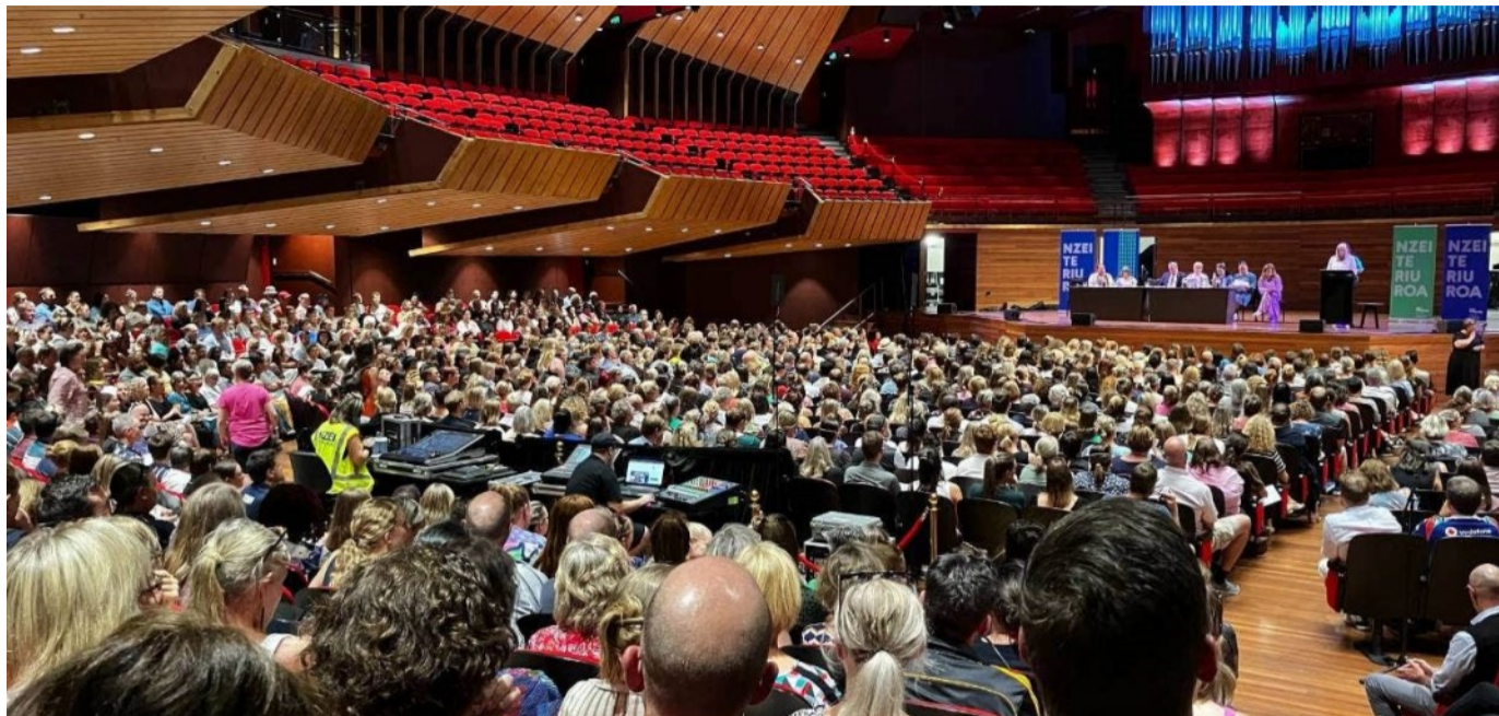
Foliga Town Hall a Kalaiesetete i le Aso Tofi tuana'i. Na matua faatumulia i susuga e tusa ma le 1500 le aofa'i.

O loo tu le ofo a le malo talu mai Tesema o le 2022, e $1500 e totogi i luma ma le 18.5 pasene e siitia ai totogi.