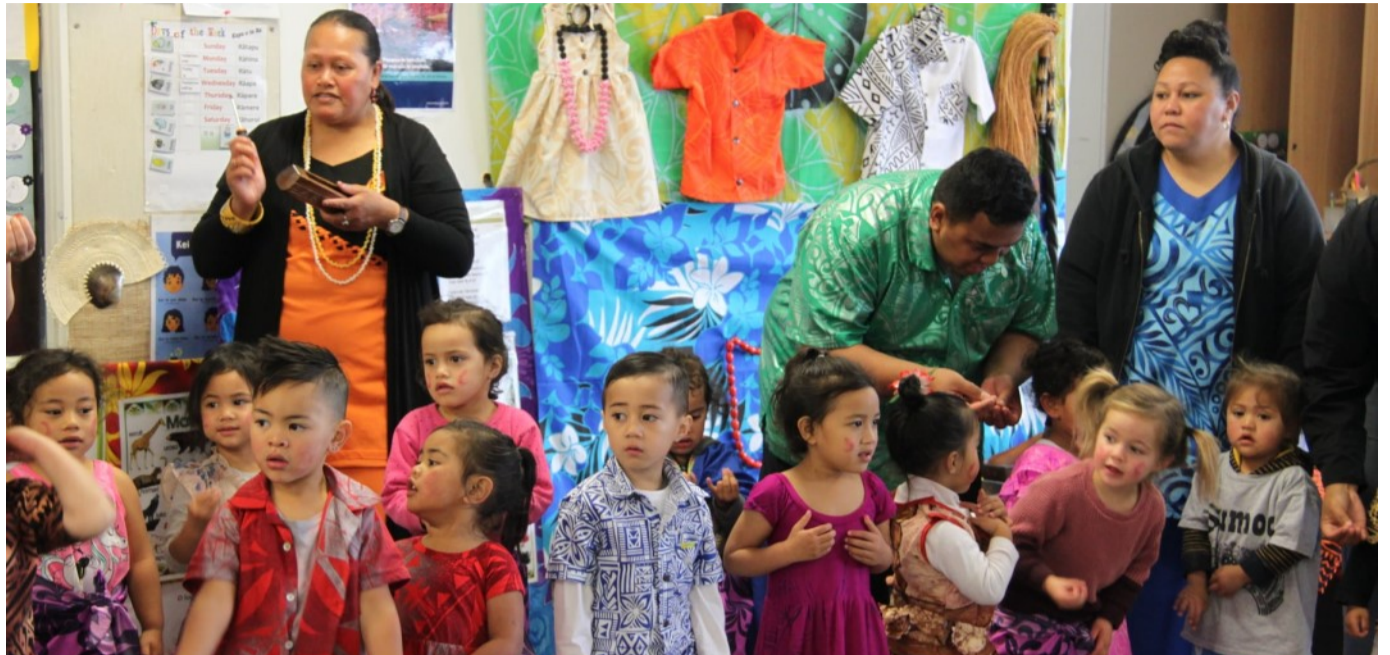
Porirua Whanau Centre o se tasi ofaga i Ueligitone e a'oa'o ai le fanau i le gagana Samoa, e fai foi sona sao i le atina'e o fanau

Muamua, e fa pulega o loo faasoaina se vaega tele o le $2.3 piona mai le malo mo le atina'e o a'oga amata. Ae a fua i le tulaga o mea e tua i ai fanau ma faia'oga, e le o atagia ai sea tufatufaga maoa'e, molimau Duff. O ofaga e tumu i pelesitika ma mea faafoliga, o faia'oga ua tauau e siilima, o faia'oga ma pili e le totogiina. Ona o na faaletonu ua mumusu ai nisi matua e ave a latou fanau i le a'oga.