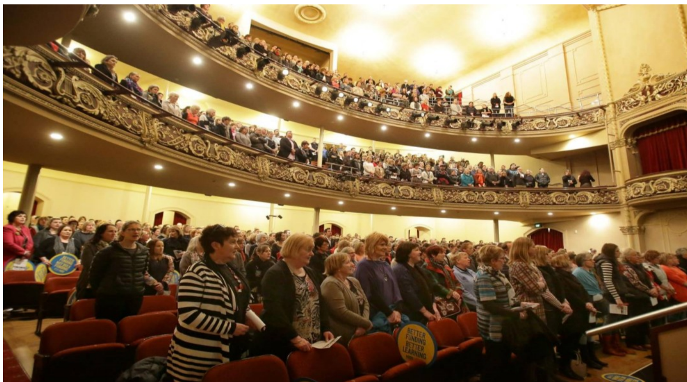
Sui o le NZEI i le itumalo o Southland e feoloolo foi le to'atele, faatasi ma sui o a'oga amata, e amana'ia foi so latou leo i taupulega a le iuni

E mana'omia e faia'oga se faiga e lagolagosua i a latou taumafaiga. Amata i se si'osi'omaga fiafia ma saogalemu. O le tasi mafua'aga na te'ena ai le ofo muamua, ona o le leai o se tali a le malo i le faafitauli o le to'atele o tamaiti i se vasega. Faapena foi se faiga e lagolago ai le pulea'oga ma e i le pulega sinia. O se tasi lea fe'au sa leotele lona faaleoga i le fono.