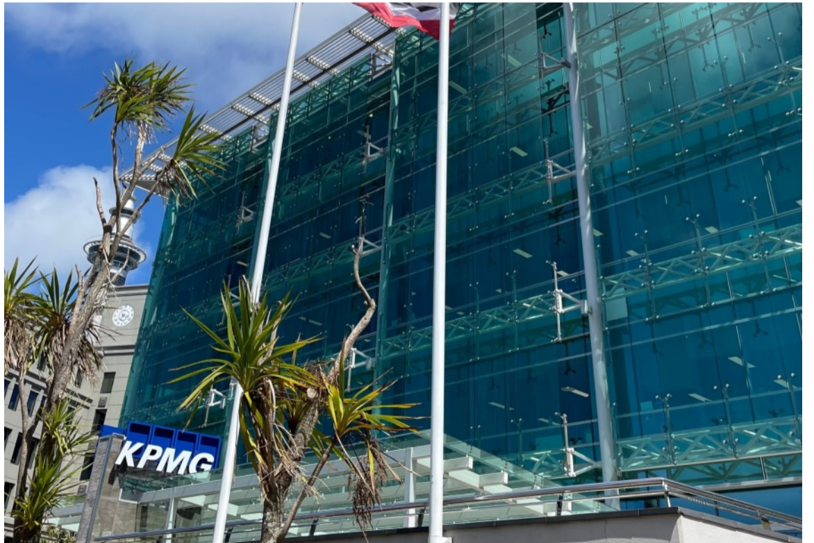
KPMG o se tasi kamupani faipisinisi i Niu Sila, i le lisi o pisinisi tetele, pei foi o le Best Start mo a'oga

E le talia e Luxon le taofi o lenei fuafuaga o le a una'ia ai nisi siitaga mo matua i a'oga amata. O lona