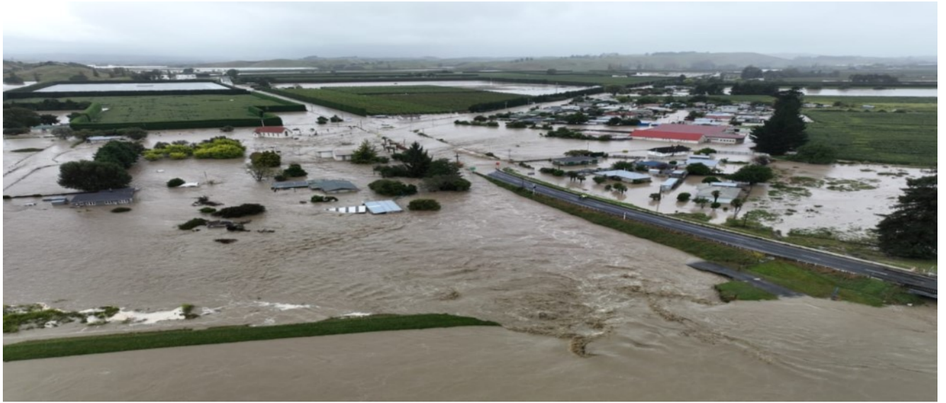
LOFIA I LE PULE A LE SUAVAI: Se va'aiga i se vaega o le itumalo o Hawkes Bay na iloga le pagatia i timuga aveva ma lologa

Fai mai le palemia fou, Chris Hipkins, o le ulua'i malaia faanatura leni ua lofia ai Niu Sila i se tulaga pagatia, i se tupulaga. Moni e laitiiti le afaina i le soifua maumau (11 maliliu e aulia mai leni taimi), e faatusatusa ma isi faalavelave, ae maua lona tau ma le afaina i le tamaoaiga, ae faapea aiga i meatotino, ae le ta'ua isi maumau i tautua e iai